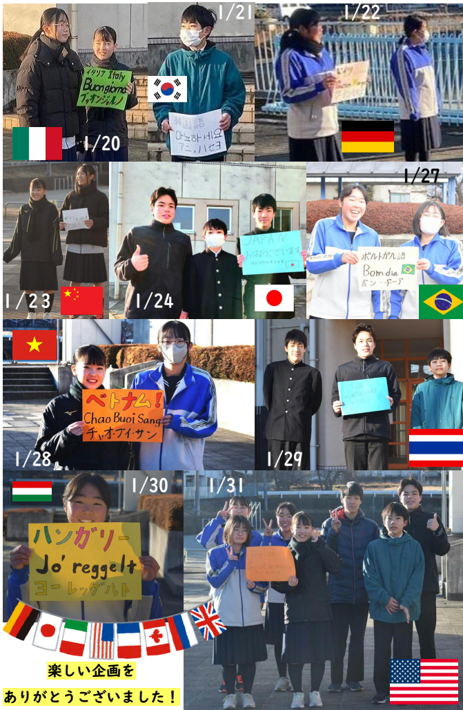
楽しい企画を ありがとうございました！