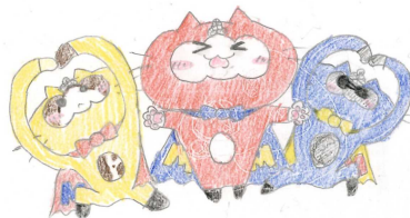
三珠中マスコットキャラクター 「MTMレンジャー」