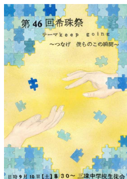
塩三島年 るりさん