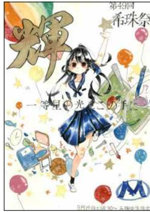
一三瀬年 子音さん