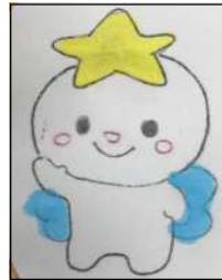
三珠中マスコット キャラクター 「ミスター」